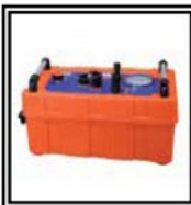
Central óleo dinámica