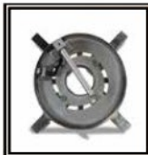
Cuello porta bridas