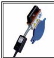
Placa térmica con Digital Dragon