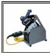
Soporte Placa térmica y Fresadora