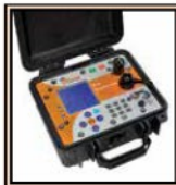
The INSPECTOR Data-logging