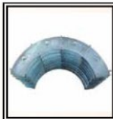
Reducciones Ø 40/140 mm