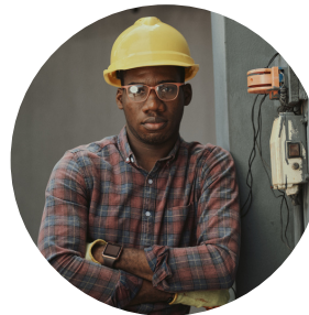
MANTENIMIENTO A EQUIPOS HIDRÁULICOS