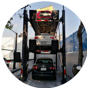
SISTEMAS DE ESTACIONAMIENTO