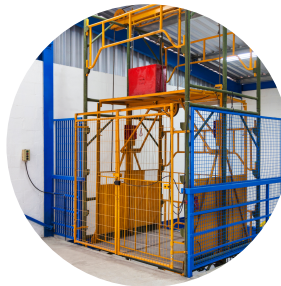
PLATAFORMAS ELEVA AUTOS