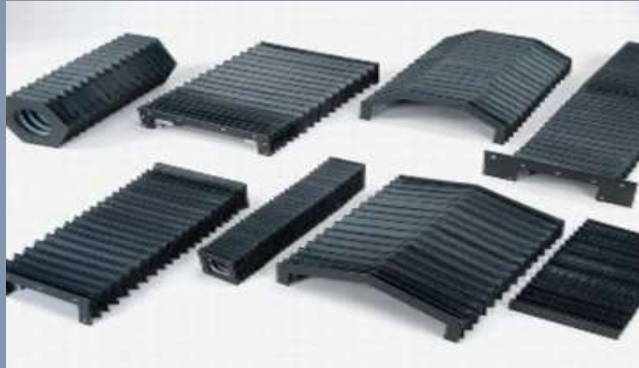
Guardas tipo fuelle o tipo acordeón