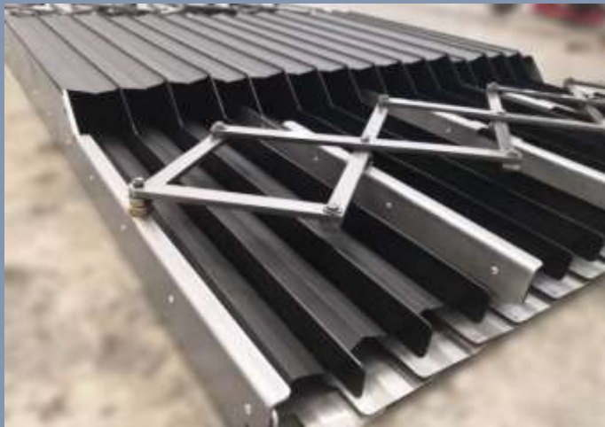
Guardas Dual Acordeón con Refuerzo Metálico