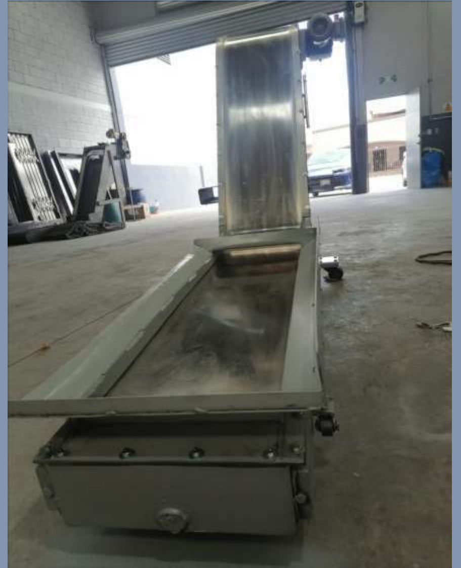
Chip conveyor tipo magnético