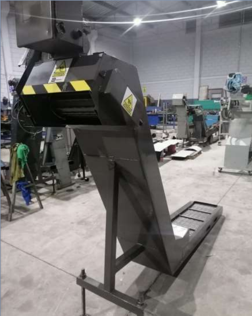
Chip conveyor tipo bisagra