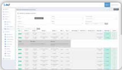
Historial por Activo

El SAAF contiene las funciones más innovadoras en control de activo fijo, como son: