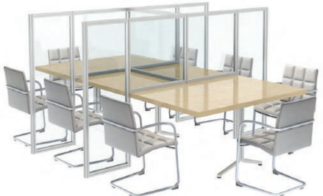
Divisores Escritorio con 4 ▶ o más módulos