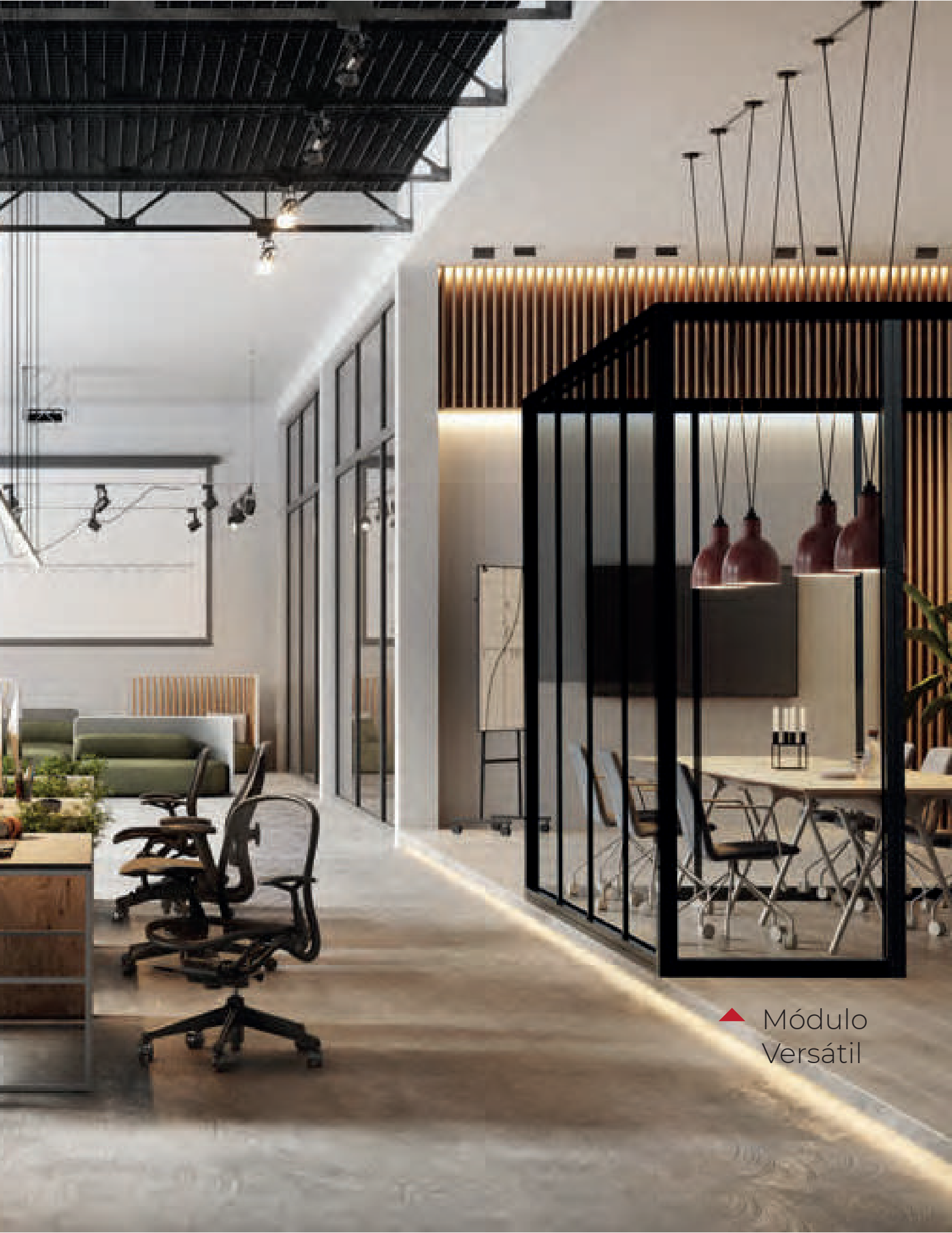
▲ Módulo Versátil