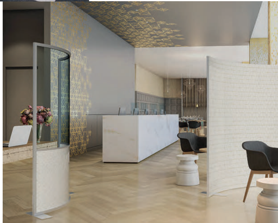
Mamparas Curvas ▶ con división