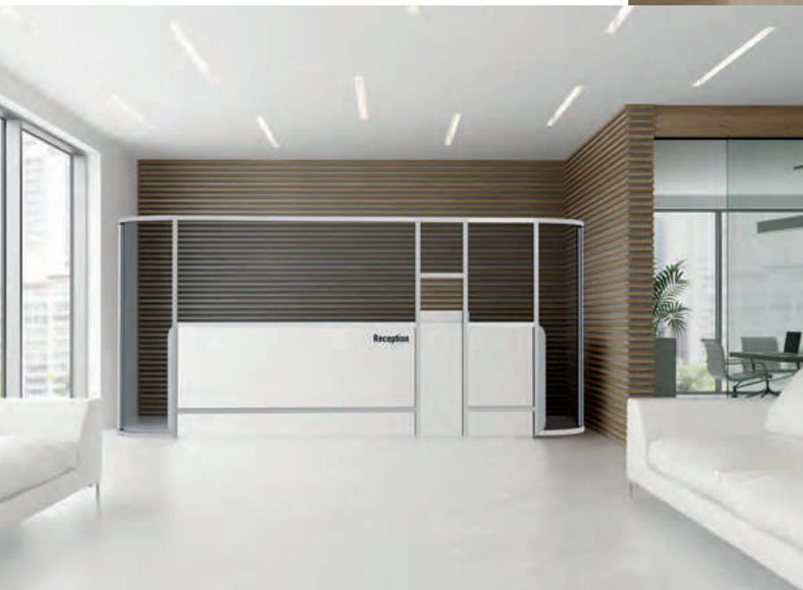
◀ Divisores de recepción