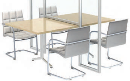
◀ Divisores Escritorio 3 módulos