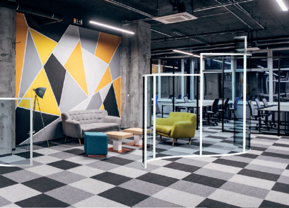
◀ Mamparas Curvas Curvas