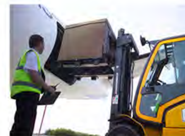
Diseño logístico moderno Patín Hidráulico o Montacargas por los 4 lados.