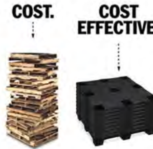
Diseño Anidable Reduce hasta un 80% Costos de Almacenaje y Envío.