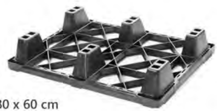
80 x 60 cm

Diseño Anidable Reduce Costos de Almacenaje y Envío. Optimiza el espacio de almacenamiento.