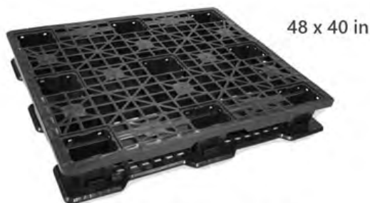
Nuestro Modelo más Vendido Resistente + Bajo Costo + Durabilidad