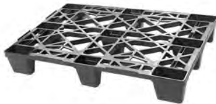
Modelo EuroPallet Aprobada por Normas Aduaneras Internacionales