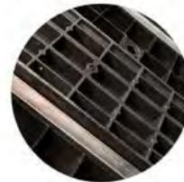
Reforzado con Barras de Acero