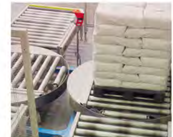
Uso con Patín Hidráulico y Montacargas por los 4 lados

Superficie cerrada: muy higiénico y fácil de limpiar Industria Alimenticia o Farmacéutica