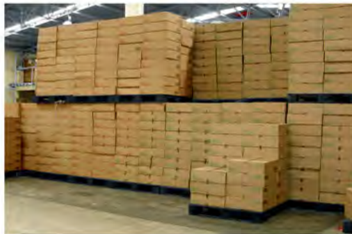
Perfecta para Estibar y Almacenar Productos