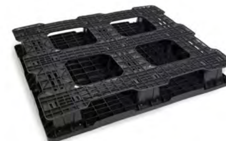
4 WAY Pallet Patín Hidráulico o Montacargas por los 4 lados.