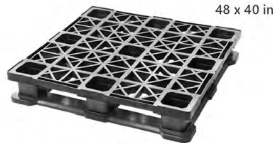
Nuestro Modelo más Vendido Resistente + Bajo Costo + Durabilidad