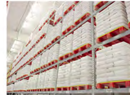
Habilitada para Racks Patín Hidráulico o Montacargas por los 4 lados.