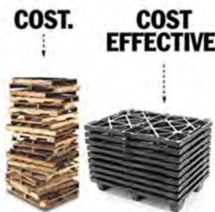
Diseño Anidable Reduce hasta un 80% Costos de Almacenaje y Envío.