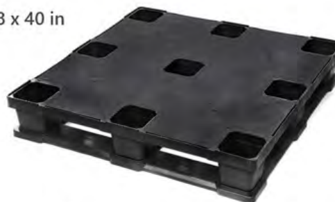
Nuestro Modelo más Vendido Resistente + Bajo Costo + Durabilidad