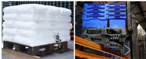
Aplicaciones de Uso Rudo Fabricado con HDPE de alta calidad Habilitada para Racks de Almacenamiento