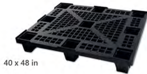
40 x 48 in