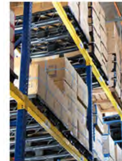
Habilitada para uso en Racks Uso con Patín Hidráulico o Montacargas