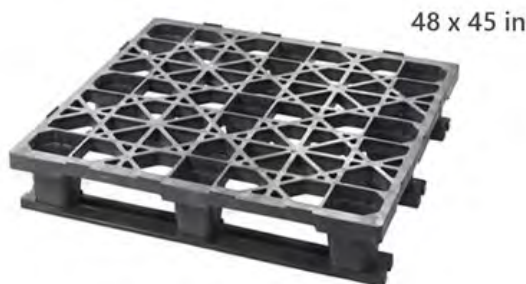
Nuestro Modelo más Vendido Resistente + Bajo Costo + Durabilidad