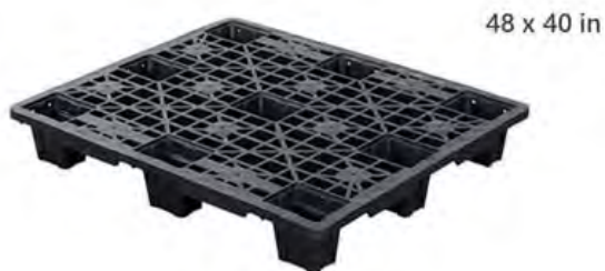
Modelo EXP-1010L Ideal para envíos