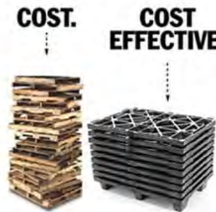
Diseño Anidable Reduce hasta un 80% Costos de Almacenaje y Envío.