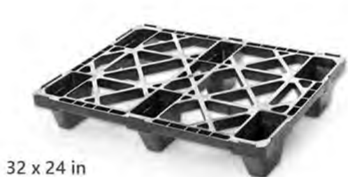
32 x 24 in

Modelo Half Pallet Diseño ergonómico, pallet ligero, práctico y resistente.