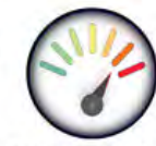
15 Toneladas Capacidad de Carga Estática