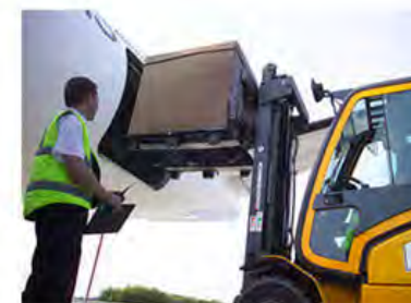
Diseño logístico moderno Patín Hidráulico o Montacargas por los 4 lados.