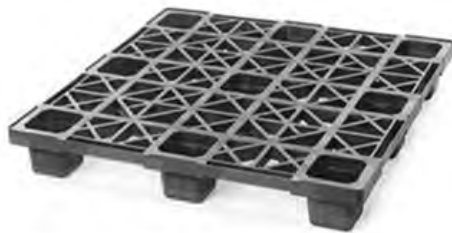
Modelo ECO-1010 (48 x 45 in) Resistente + Bajo Costo + Durabilidad 48 x 45 pulgadas