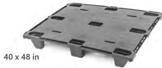
40 x 48 in