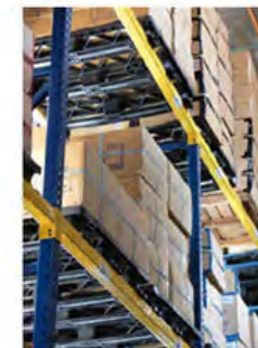
4 WAY Pallet Patín Hidráulico o Montacargas por los 4 lados.