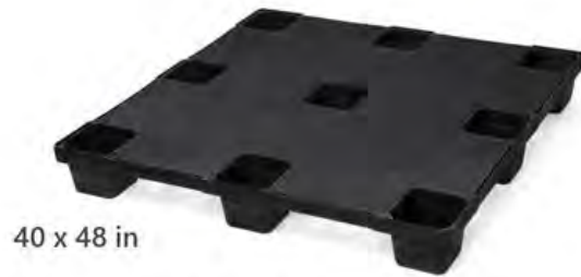
Modelo EXP-1010 Cerrada Aprobada por Normas Aduaneras Internacionales