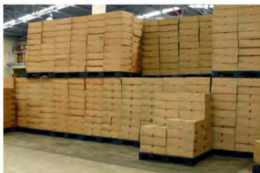
Perfecta para Estibar y Almacenar Productos