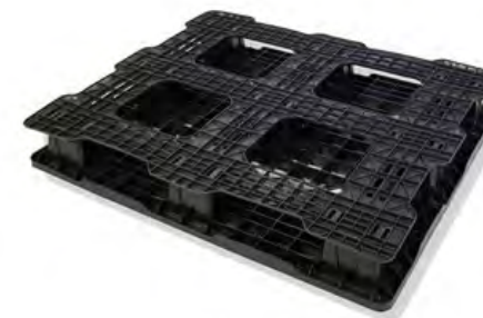
4 WAY Pallet Patín Hidráulico o Montacargas por los 4 lados.