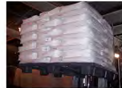
Diseño logístico moderno / 4 WAY Pallet Patín Hidráulico o Montacargas por los 4 lados.