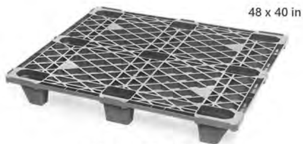
Modelo EXP-1010L Ideal para envíos