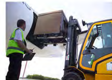
Diseño logístico moderno Patín Hidráulico o Montacargas por los 4 lados.