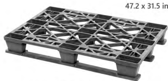
Tarima EuroPallet, 120 x 80 cm Resistente + Bajo Costo + Durabilidad