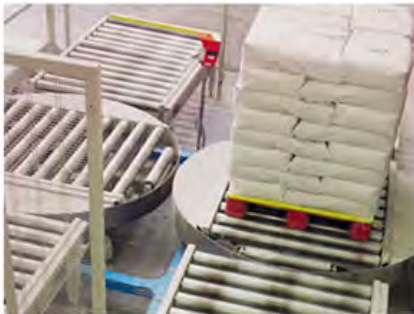
Grado Alimenticio y Farmacéutico Diseñado para Aplicaciones Exigentes