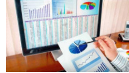
Outsourcing de Nómina