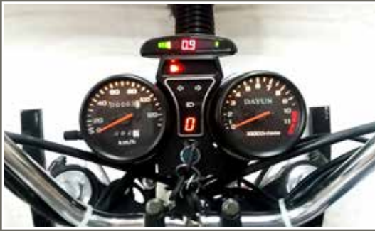
Tablero iluminado con display de proximidad y medidor de gasolina