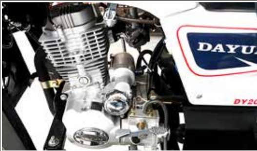
Potente motor 200 C.C.