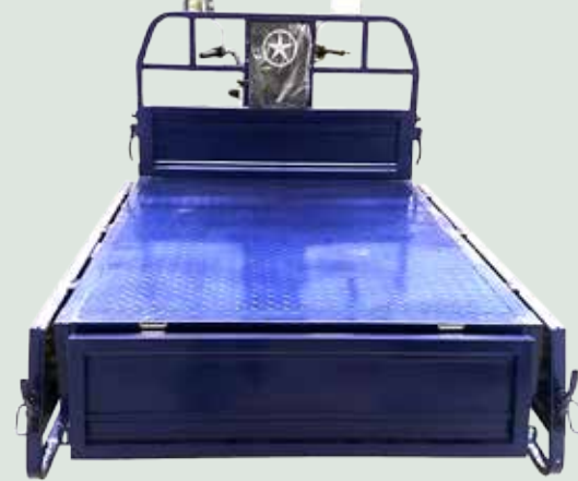
Redilas Abatibles 180°