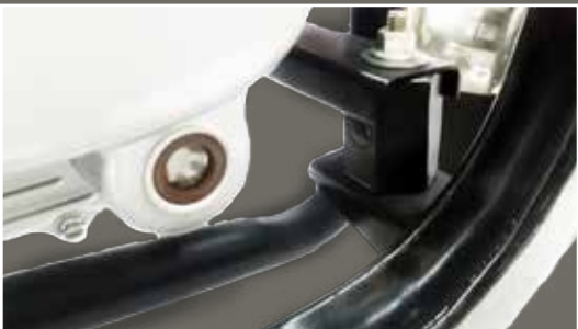
Soportes de alta resistencia