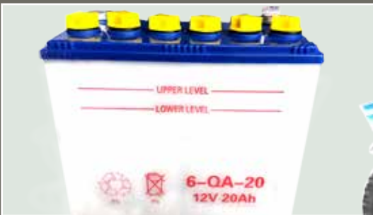
Batería de 20 amperes