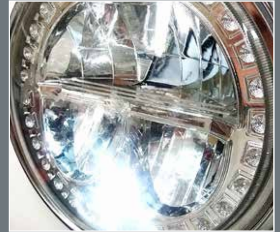
Faro de led