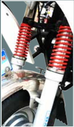
Suspensión delantera reforzada