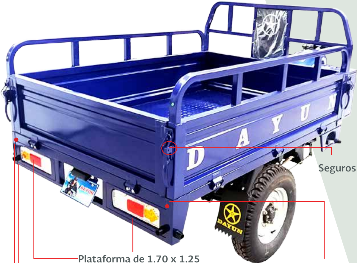
Plataforma de 1.70 x 1.25