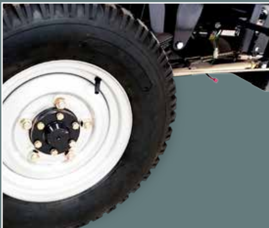
Llantas 5x12 de trabajo pesado y diferencial reforzado de 5 birlos