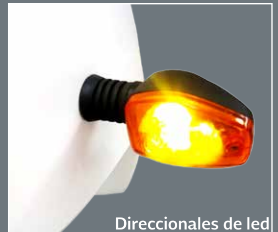
Direccionales de led