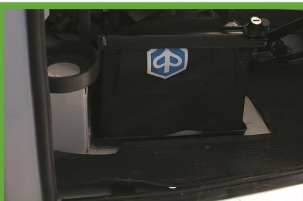
KIT DE HERRAMIENTAS

Todas las mejoras están destinadas a mejorar la seguridad durante la experiencia de manejo.