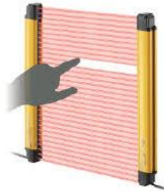
▶ Al paso 2 GL-RF