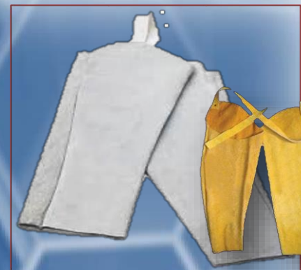
Manga recta color gris, naranja y amarillo 56 cm largo