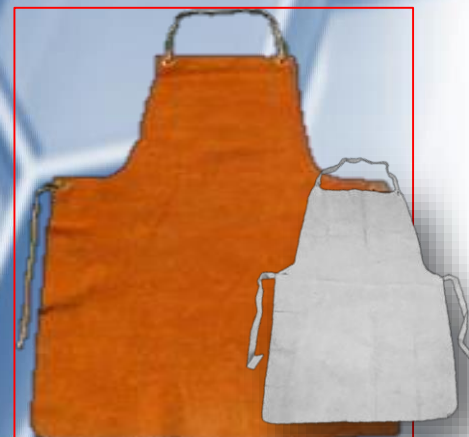
Mandil color gris y naranja medidas 60x90,55x85,60x1.10