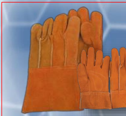
Guante color naranja y amarillo 26 cm en corto 30 cm en largo.