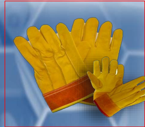
Guante operador piel res y cerdo puño de carnaza