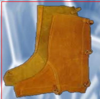
Polaina color amarillo 38 cm de largo