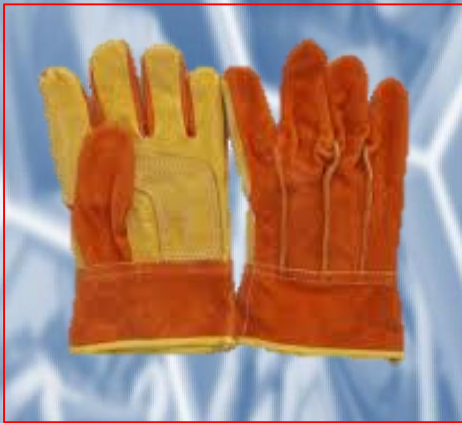
Guante combinado piel /carnaza