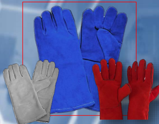
Guante tipo americano sencillo color azul , rojo y gris con forro interior hilo kevlar y/o algodón.