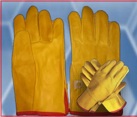
Guante argonero piel res y cerdo con cintilla en puño.