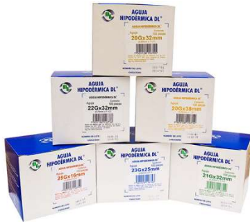
Calibre 30G Extra Corta