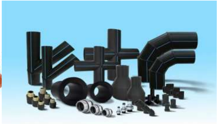
RELACIÓN DE DIMENSIONES Y PESOS DE TUBERÍA PE 4710