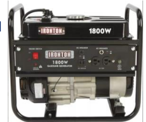
Generador Ironton 1400/1800 W

7.0 HP motor de 4 tiempos OHV • 4000 Watts de sobretensión / 3500 vatios corrientes • Motor de gasolina • Desconexión automática de aceite bajo • Interruptor de cierre del motor • Tomacorrientes de 4 - 120 Voltios A / C • Salida de 1 - 12 Voltios D / C • Depósito de combustible de 3.6 galones • 120 Voltios / 15 A / 60 Hz.