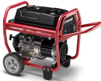
Generador Troy-Bilt 6250/8500