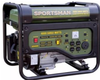
Generador Sportsman 4000 w

Tipo de motor: 389cc, OHV SUBARU Sistema de arranque: Retráctil Volumen de aceite de motor: 1,1 L (37 onza.) Volumen de combustible: 25 L (6,6 gal) Voltaje nominal: 120 V / 240 V Amperaje nominal: 41.6/20.8A Salida nominal: 5 000 W Salida máxima: 6 250 W Frecuencia nominal: 60 Hz