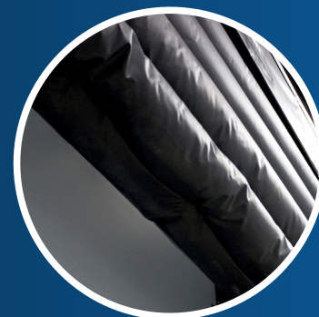
Opcional: Caída adicional en bolsa de aire de la cabeza