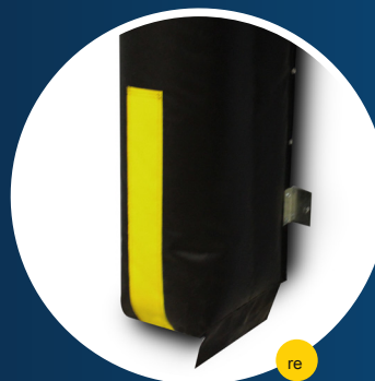
Franjas de guía de 24 "(610 mm)