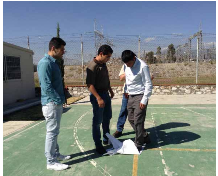
· Taller Comunicación emocional y Team Building, Pue, Pue, México