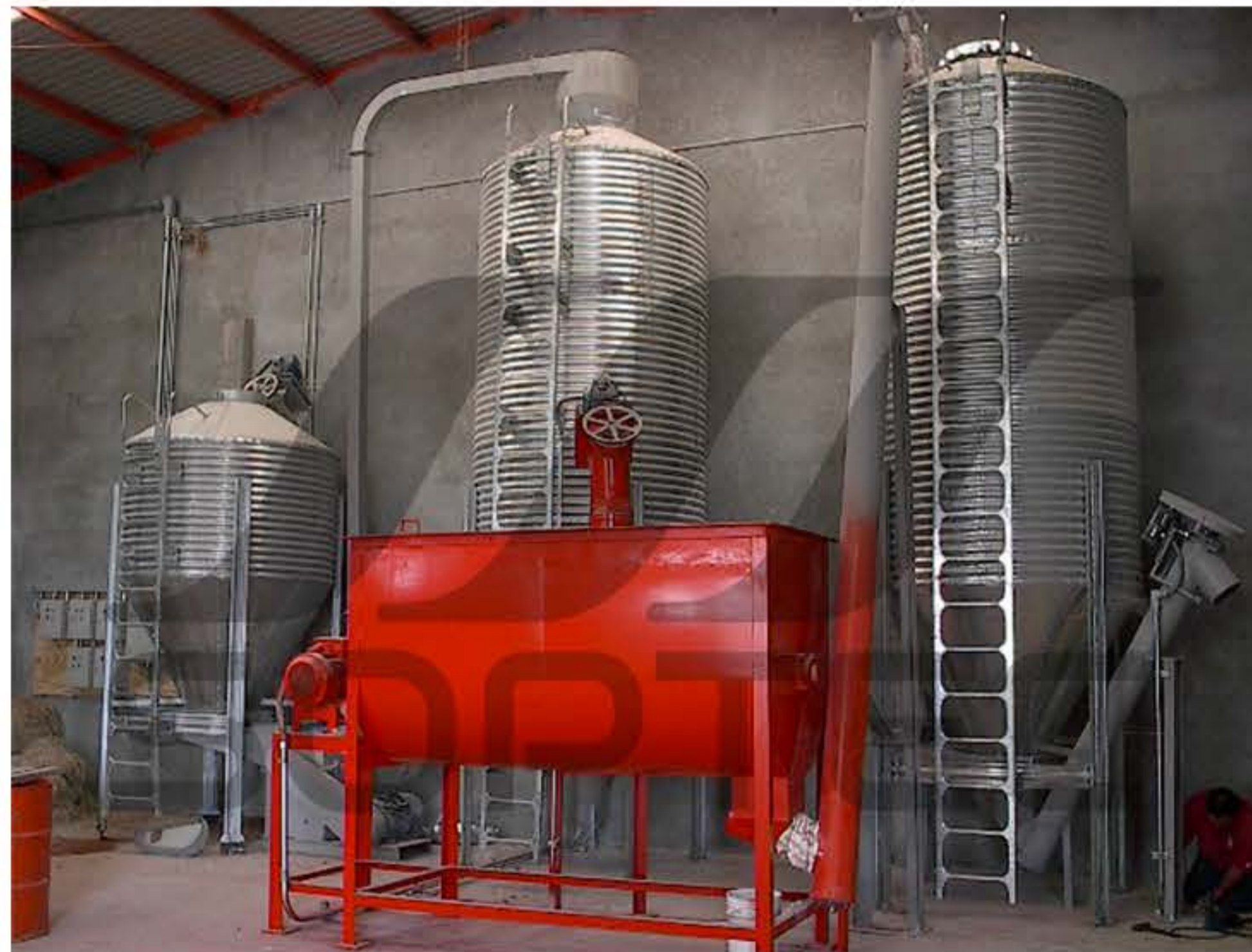
Línea de Producción