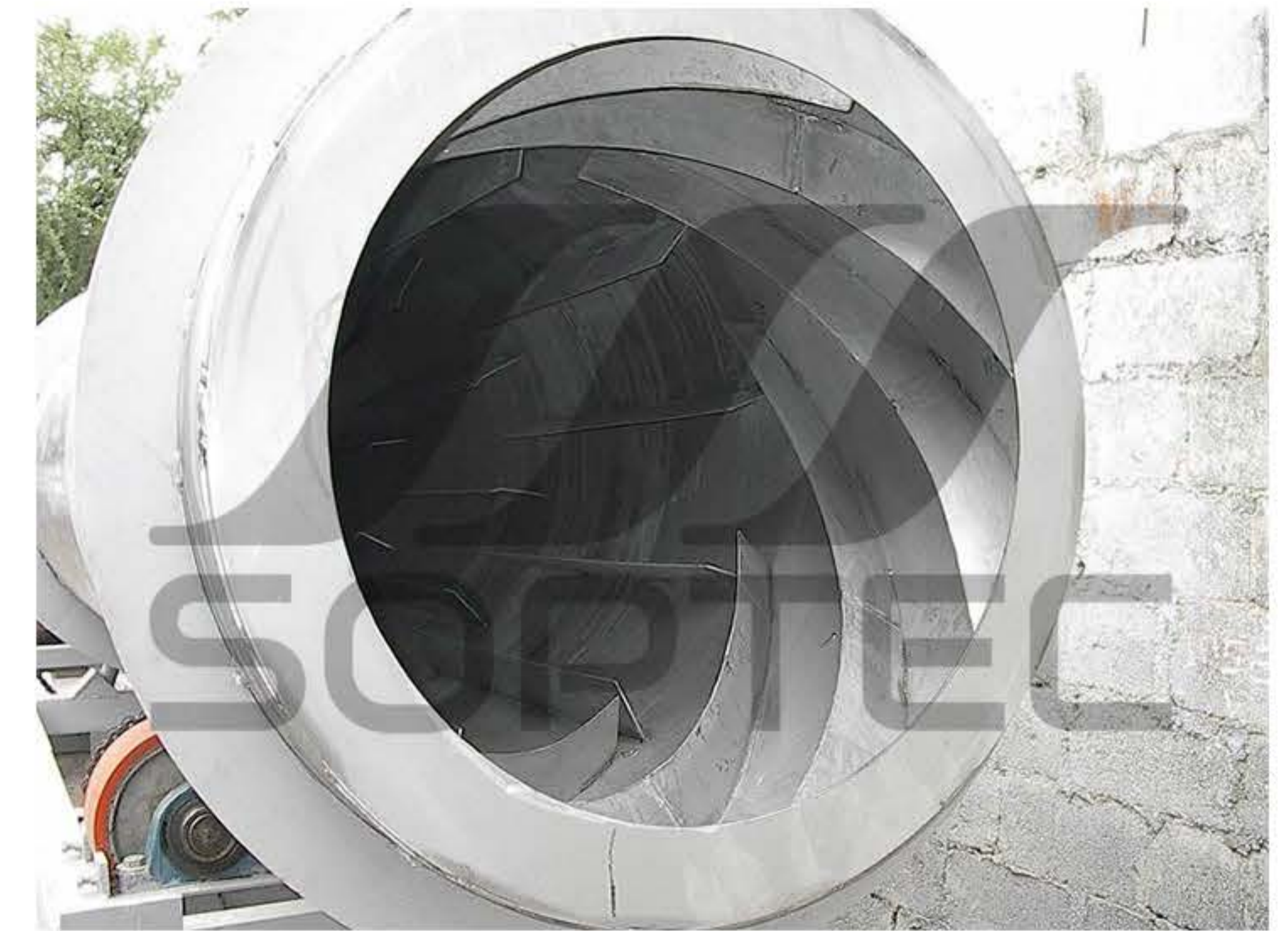
Soldadura y Pailería