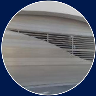
Puerta de Aluminio

¡En solución de seguridad, un solo proveedor trabajando para usted!