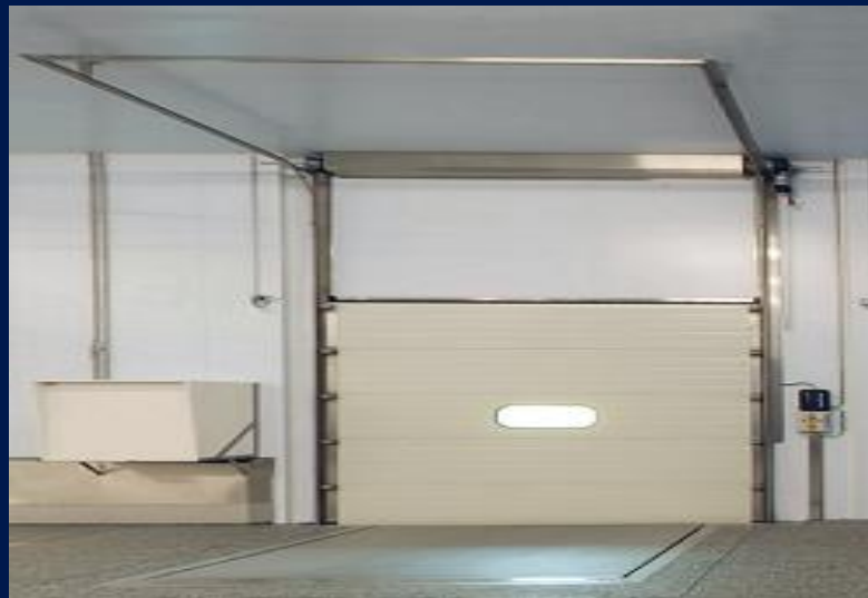
Puerta sección Industrial