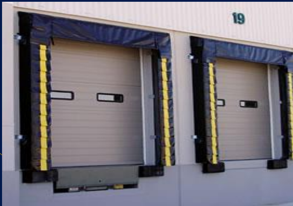
Puertas Industriales con Sello de Andén

¡En solución de seguridad, un solo proveedor trabajando para usted!