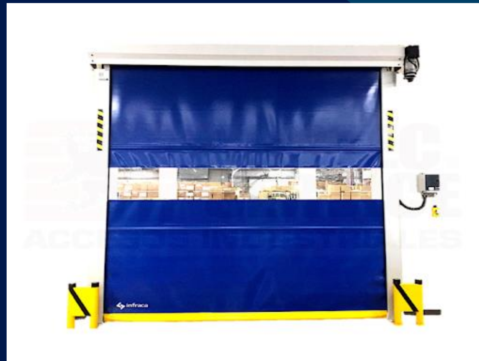
Cortina Rápida ideal para paso de montacargas