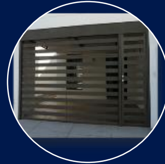
Puerta de Herrería