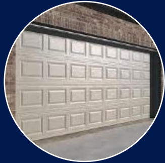
Puerta tipo Americano