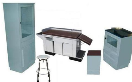
SMI-JCFPI CONSULTORIO FUTURO PEDIATRICO