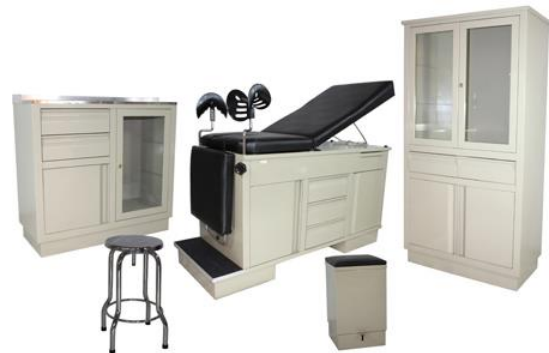
JUEGO DE CONSULTORIO FUTURA