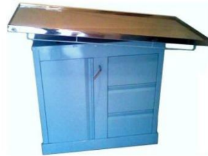
MESA DE EXPLORACION VETERIANARIA