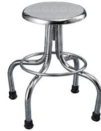
BANCO GIRATORIO DE ACERO/INOX