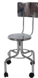
BANCO CON RESPALDO Y RUEDAS