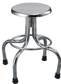
BANCO GIRATORIO CROMADO ECONOMICO