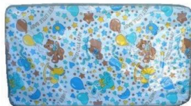
Cuna para hospital 1 posiciones, incluye colchón y pijamera med. 060X1.12 cm