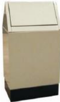
BOTE DE BASURA CON PEDAL Y COJIN