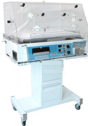
Incubadora de Gabinete Económica marca SMI