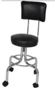
BANCO TAPIZADO CON RESPALDO