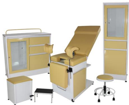
SMI-JCII JUEGO DE CONSULTORIO ISIS