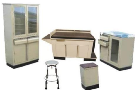
SMI-JCFP 2 CONSULTORIO DOBLE PEDIATRICO