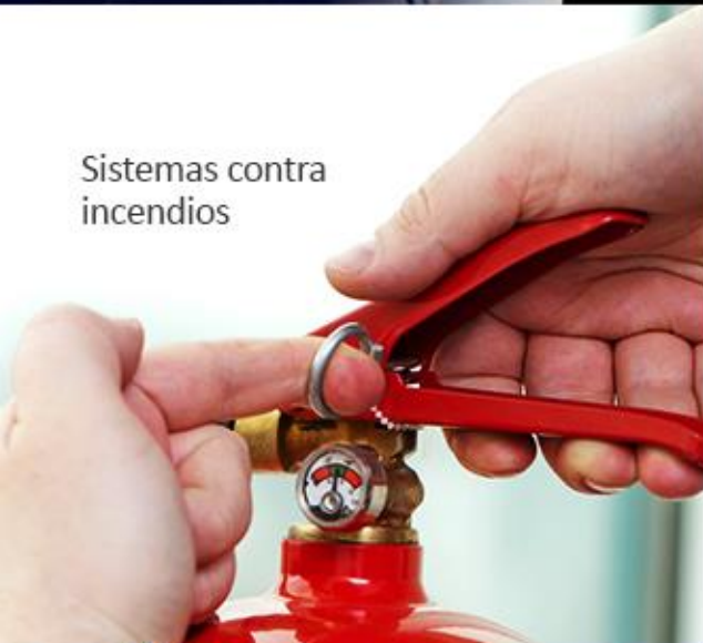
Sistemas contra incendios