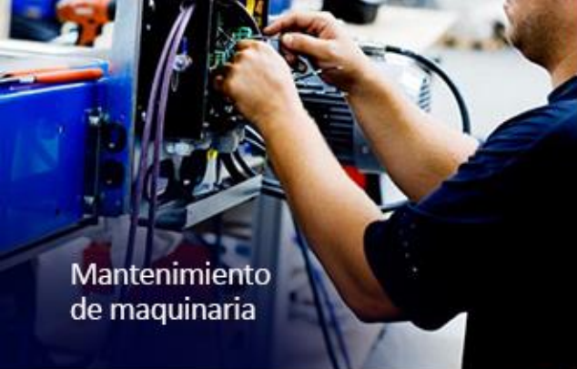
Mantenimiento de maquinaria