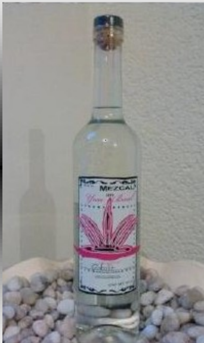
MEZCAL JOVEN 100 % AGAVE SILVESTRE

La CALIDAD de los Magueyes se inicia en la tierra y en el cuidado de los mismos; todos los trabajos, como son: la siembra, el corte y la destilación se realizan de forma manual, se trata de procesos siempre respetuosos con el medio ambiente.