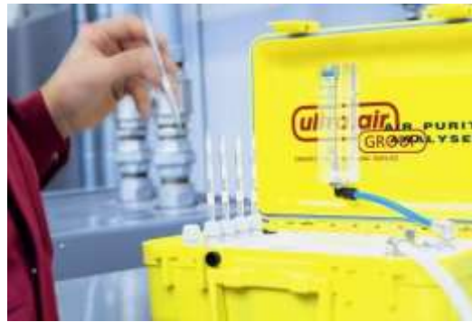
Mediciones en calidad de aire, flujo/volumen, aire respirable, nivel de ruido, entre otros.