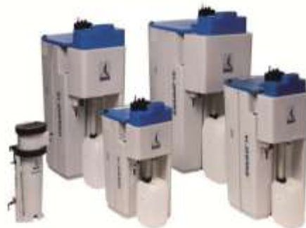
Tratamiento de condensados