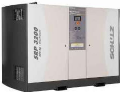
Compresores de aire