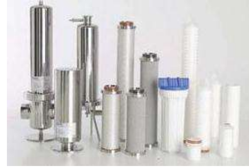
Filtración de proceso