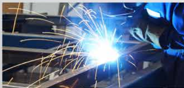
▲ NUESTROS PROCESOS DE FABRICACIÓN CUMPLEN CON LOS REQUERIMIENTOS DE LA NORMA NMX-CC-2001-IMNC-2008