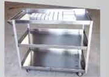
FABRICACIÓN DE PIEZAS EN ACERO INOXIDABLE ▲