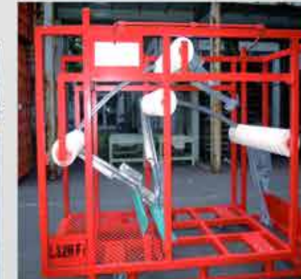
TRANSPORTE DE RACKS Y ESTRUCTURAS METÁLICAS ▲