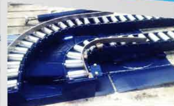
FABRICACIÓN DE RODILLOS METÁLICOS Y CAMAS TRANSPORTACIÓN