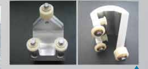
PIEZAS EN ACERO ALUMINIO BRONCE Y NYLAMID ▲