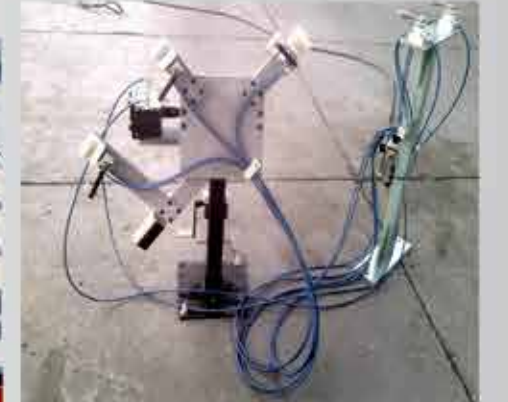
▲ DISPOSITIVO NEUMÁTICO PARA PULIDO DE MARCOS PARA PUERTAS TRACERAS Y DELANTERAS DE NISSAN SENTRA