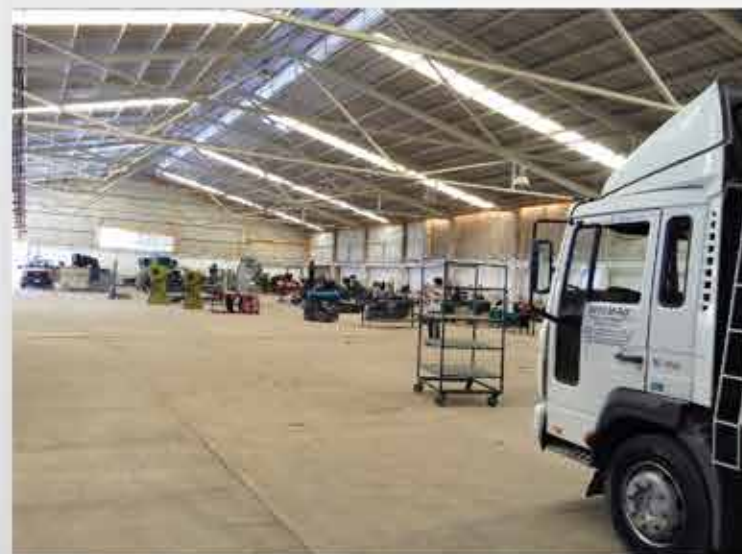
NAVE INDUSTRIAL CON 2,000 METROS CUADRADOS ▲