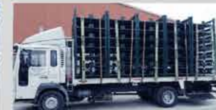
TRANSPORTE DE RACKS Y ESTRUCTURAS METÁLICAS ▲