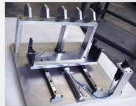
▲ DISPOSITIVO NEUMÁTICO EN ACERO INOXIDABLE PARA ENSAMBLE DE PARTES DE COPIADORAS