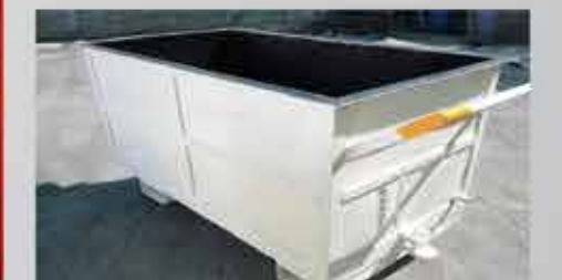
▲ FABRICACIÓN DE PIEZAS METÁLICAS EN ACERO AL CARBÓN