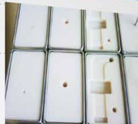
PIEZAS MAQUINADAS EN NYLAMID ▲

INTEMAQ INDUSTRIAL TÉCNICA EN MAQUINADOS Y PAILERÍA