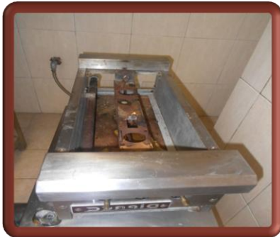
Antes y después de un Mantenimiento