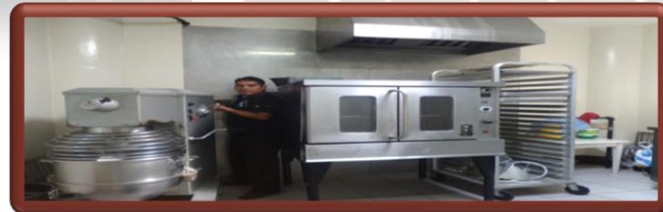
Instalación de equipos