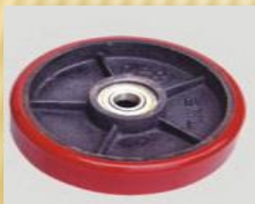
Rueda direccional Poliuretano