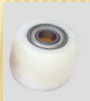
Rueda de carga Nylon