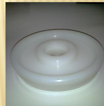
Rueda direccional Inyección