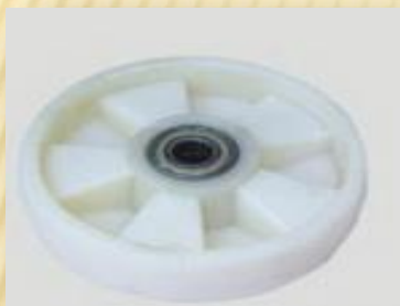
Rueda direccional Nylon