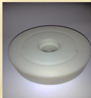
Rueda direccional Nylamid