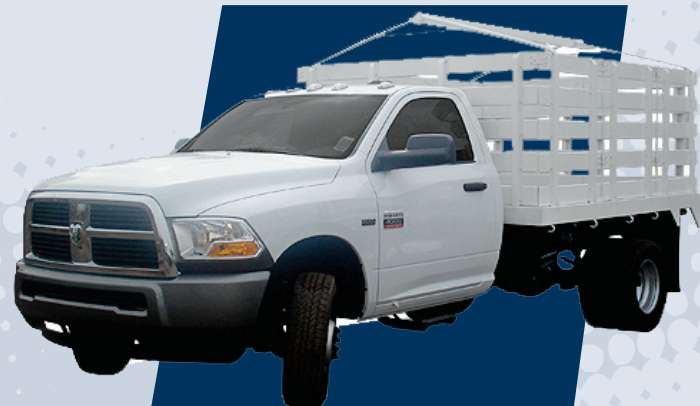
RAM 4000 Redilas