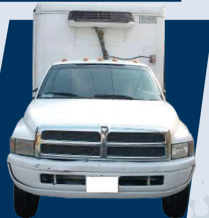
RAM 4000 Caja Refrigerada