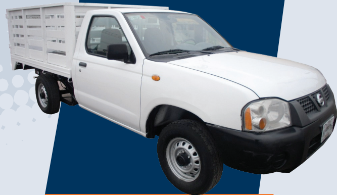
Nissan Pick up Redilas