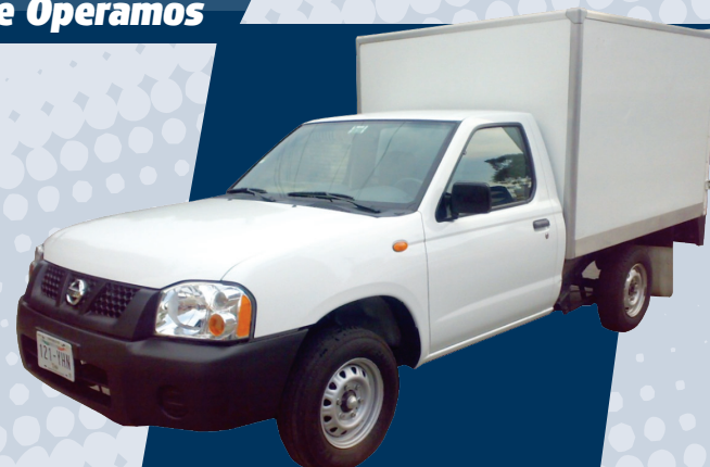
Nissan Caja Seca