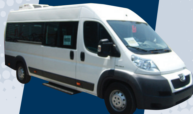
Peugeot Manager Turismo 17 pasajeros