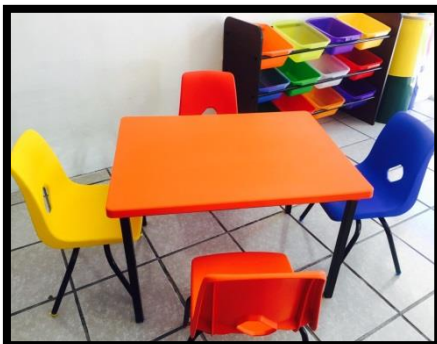
MESA EN POLIPROPILENO