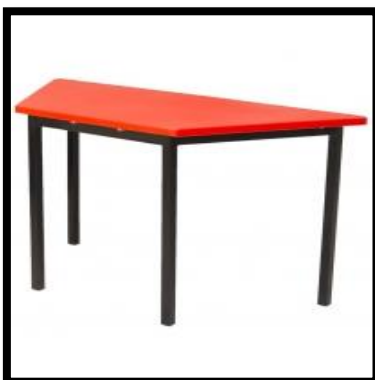
MESA TRAPEZOIDAL POLIPROPILENO