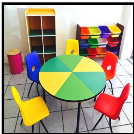
MESA CIRCULAR COLORS