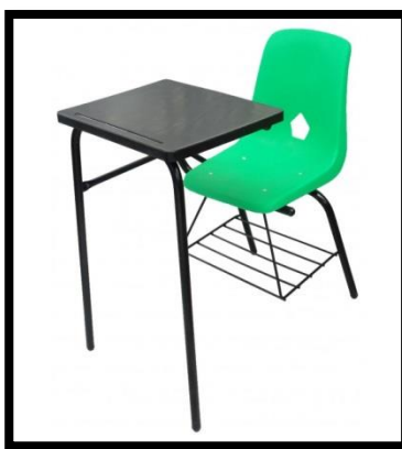
MESABANCO INDIVIDUAL EN CONCHA