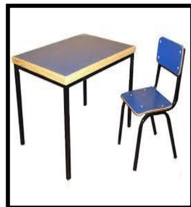
MESA CUBIERTA EN FORMAICA