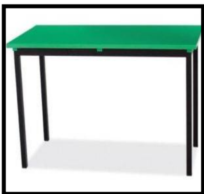
MESA BINARIA POLIPROPILENO