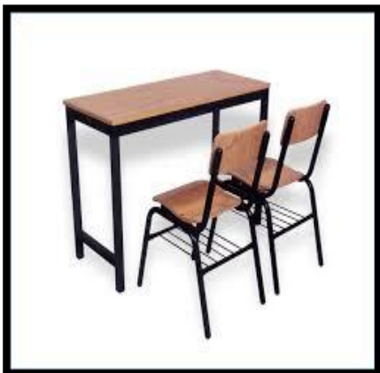
MESA BINARIA TUBULAR/TPY