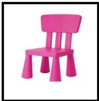
SILLA MODELO LINK