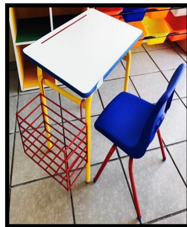
ESCRITORIO INFANTIL PEGASSO