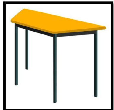
MESA TRAPEZOIDAL PRIMARIA EN POLIPROPILENO