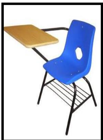
BUTACA EN CONCHA PALETA JUMBO TPY