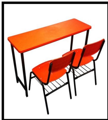
MESA BINARIA TUBULAR//POLIPROPILENO