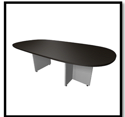
MESA DE JUNAS