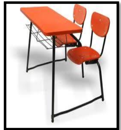
MESABANCO DUPLEX EN POLIPROPILENO