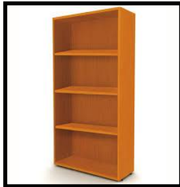
LIBREROS CON REPISAS