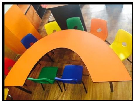
MESA MODELO ARCOIRIS