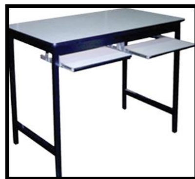
MESA DUAL COMPUTO