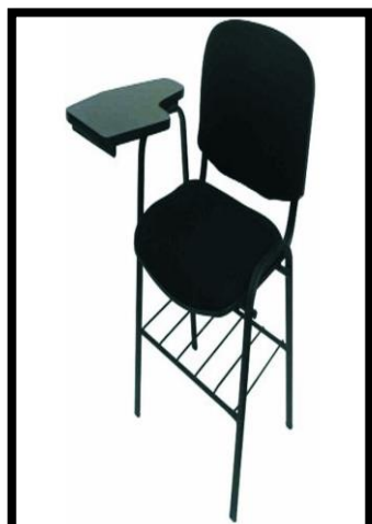
BUTACA ISO ACOJINADA