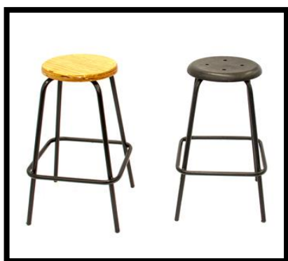
BANCOS DE LABORATORIO