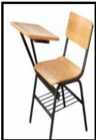
BUTACA TUB/TPY JUMBO