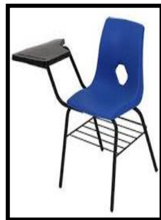
BUTACA EN CONCHA