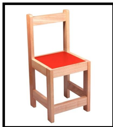
SILLA EN MADERA