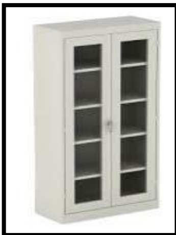
GABINETE CON PUERTAS DE CRISTAL