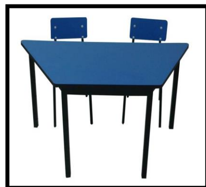
MESA TRAPEZOIDAL FORMAICA