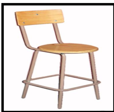
BANCOS DE LABORATORIO CON RESPLADO