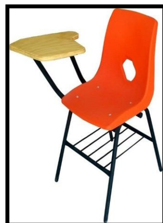
BUTACA EN CONCHA PALETA TRIPLAY