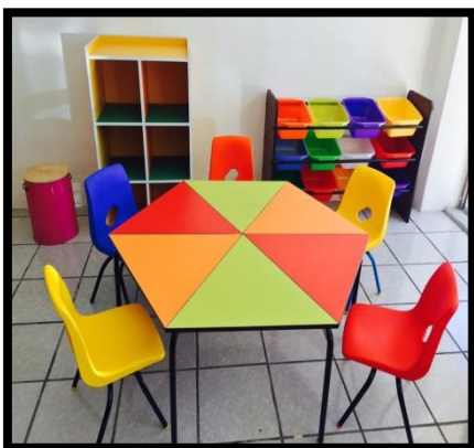
MESA HEXAGONAL COLORES