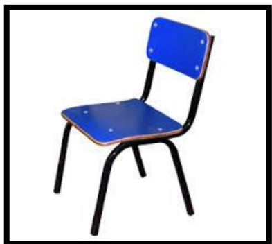
SILLA EN FORMAICA