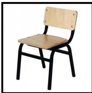
SILLA EN TRIPLAY