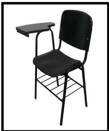
BUTACA ISO PLASTIC