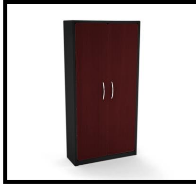
LIBREROS CON PUERTA