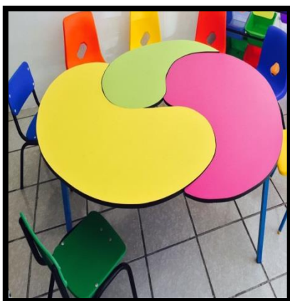
MESA MODELO LLUVIA