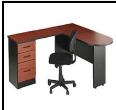
ESCRITORIOS EN ESCUADRA