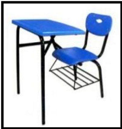
MESABANCO INDIVIDUAL EN POLIPROPILENO 2