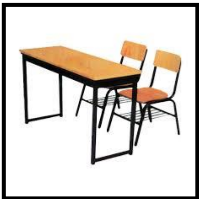
MESA BINARIA TUB/TPY