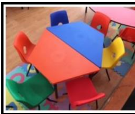
MESA TRAPEZOIDAL POLIPROPILENO