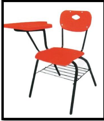
BUTACA EN POLIPROPILENO 2