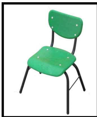
SILLA EN POLIPROPILENO