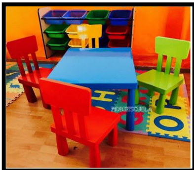
MESA MODELO LINK