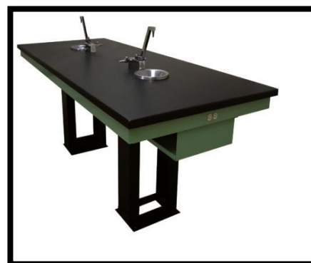
MESA DE LABORATORIO