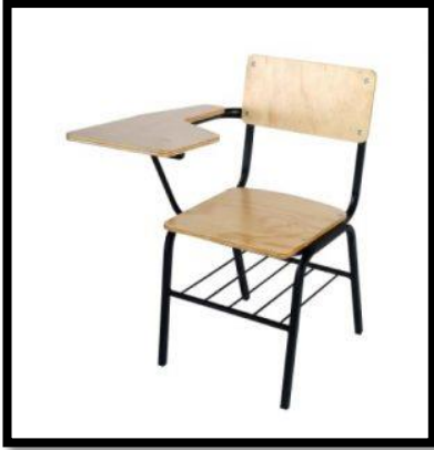
BUTACA EN TUBULAR/TPY