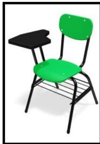
BUTACA TUB/POLIPROP. 2