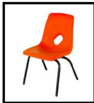
SILLA EN CONCHA