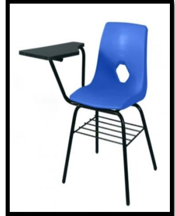
BUTACA EN CONCHA