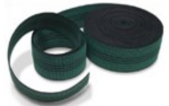
BANDASTIC LIGERO Estiramiento 90% Ancho 5 y 7cm