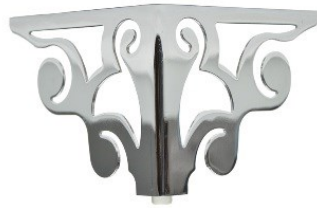
PATA GRECIA Medida 120 mm Color cromo