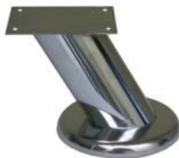
PATA PARIS Color Cromo Medida 100 mm