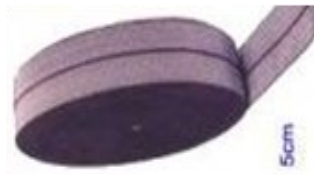
BANDASTIC PLUS Estiramiento 90% Ancho 5 cm