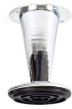
PATA MATIZ Color Cromo Medida 100 mm