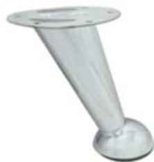
PATA ALEMANA Color cromo Medida 120 mm