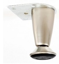
PATA MURANO Color Niquel Satin Medida 53, 78 mm