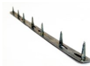
TACHELADA SIN Galvanizado Medida 70 cm