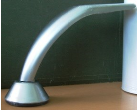
CAMPANA RECTA Color cromo y cromo mate