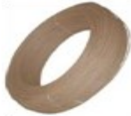
ALAMBRE EMPAPELADO Calibre 16