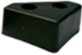
TRIANGULO C. Medida 25 mm Color Café y Negro