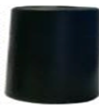
PATA CILINDRICA Medida 5, 7, 10 cm Color Negro