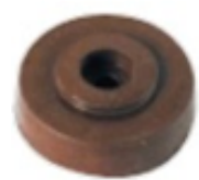
PATA GALLETA Medida 1 cm Color Cafe