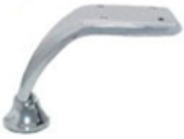
PATA CURVA medida 52 x 101 Color niquel satin