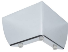
PATA SONICO medida 55, 88 mm Color cromo