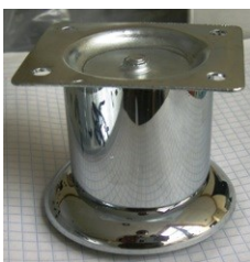
TUBO RECTO Color cromo Medida 6,10,12,14 cm