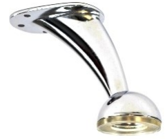
PATA BORA medida 100 y 140 mm Cromo y Niquel Satin