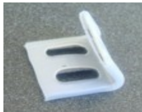
CLIP ASIENTO Color Blanco Cubierto Plastico