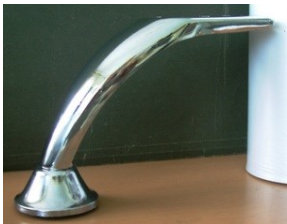
CAMPANA CURVA Color cromo y cromo mate