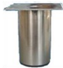
PATA CROMADA Medida 100 mm Color Cromo