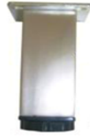
PATA LANCER medida 100 mm Cromo y Niquel satin