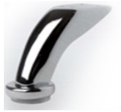
PATA FRANCIA Color cromo y Niquel satin