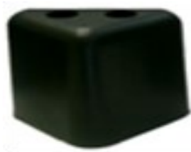
TRIANGULO G. Medida 60 mm Color Café y Negro