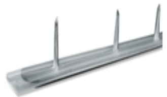
TACHELADA CON Funda Plastica Trans Medida 70 cm