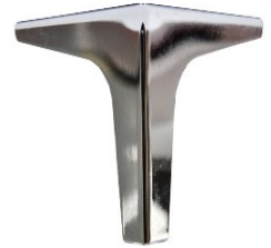
PATA EDGE Color Cromo Medida 130 mm