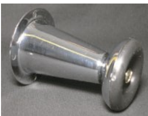
PATA CONO Color cromo y cromo mate