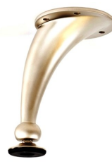
PATA TOLEDO ECO Color Niquel Satin Medida 100 y 125 mm