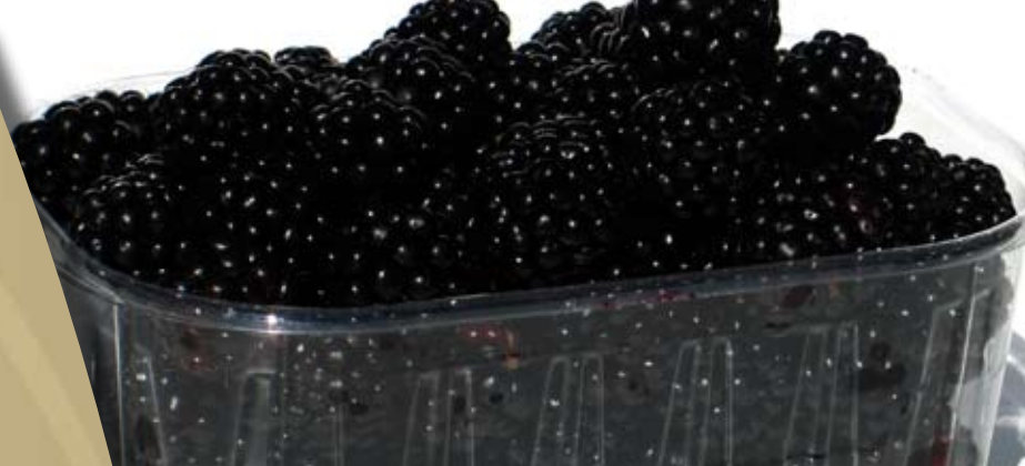
Table Jams Cooking Jams Pastry Fillings Glazes Butterscotch-flavored Syrup Yoghurt Bases