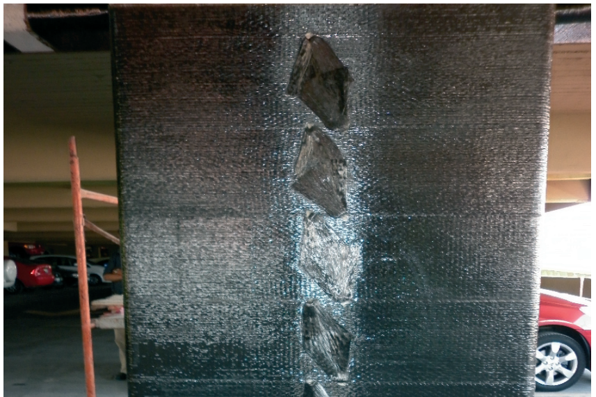
Reforzamiento de losa de entrepiso en lecho superior con SikaWrap 300 C Z..