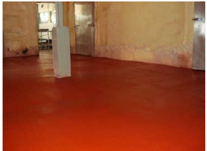
Sistema Mortero Cementicio Uretano a 7 mm de espesor en cámaras de congelación.