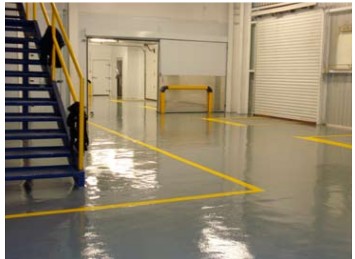
Sistema Mortero epóxico a 4mm, en áreas de producción de almacén y pasillos.