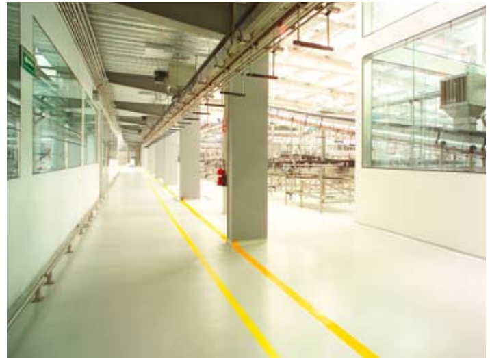
Mortero epóxico a 3 y 6 mm en áreas de producción y pasillos.