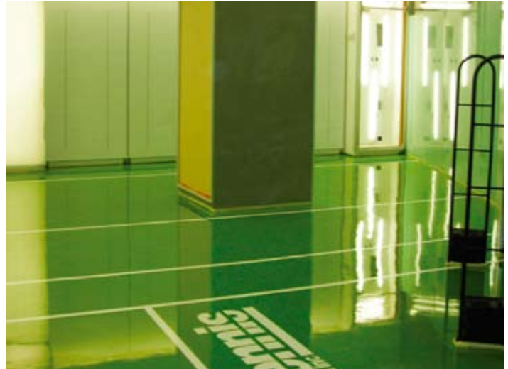
Autonivelante decorativo con detalles en vinilo.