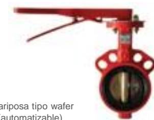
Válvula mariposa tipo wafer línea roja (automatizable)