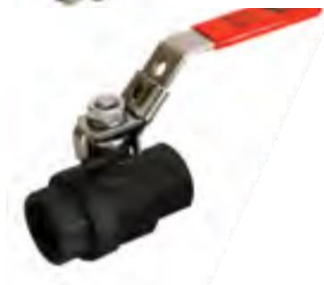
Válvula esfera paso completo, cpo. de 2 pzas. 1000 WOG