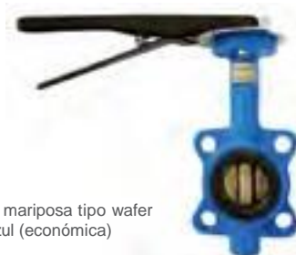
Válvula mariposa tipo wafer línea azul (económica)