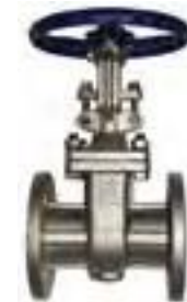
Válvula compuerta de acero inoxidable bridada 150 lbs.