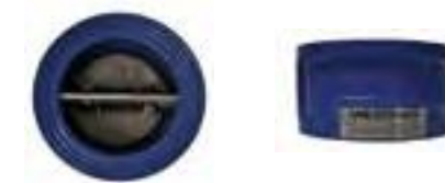
Válvula duo-check clase 125