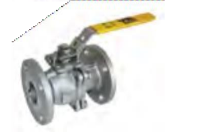
Válvula esfera 150 y 300 lbs. Bridada, cpo. de 2 pzas. en acero al carbón y acero inoxidable.