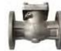
Válvula retención de acero inoxidable bridada 150 lbs.