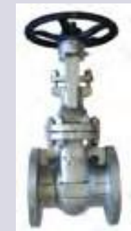
Válvula compuerta de acero fundido bridada 150 lbs.