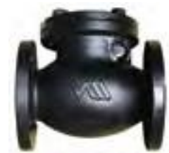
Válvula retención de hierro bridada 125 lbs.