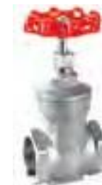
Válvula compuerta de acero inoxidable roscada 200 lbs.