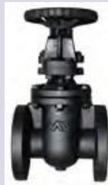
Válvula compuerta de hierro bridada 125 lbs. vástago saliente