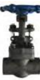
Válvula globo de acero forjado clase 800 roscada y socket weld