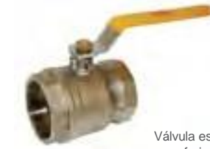
Válvula esfera de latón forjado 400 WOG