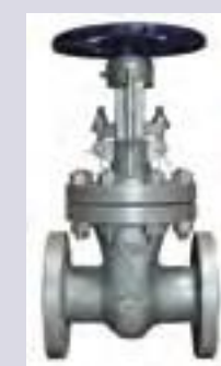
Válvula compuerta de acero fundido bridada 300 lbs.