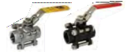
Válvula esfera paso completo, cpo. de 3 pzas. 1000 WOG