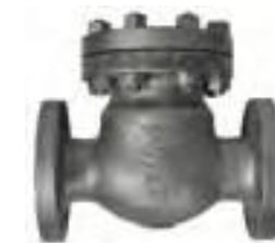
Válvula retención de acero fundido bridada 300 lbs.