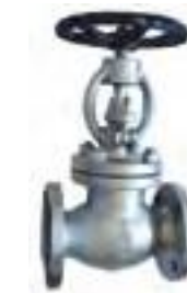
Válvula globo de acero fundido bridada 150 lbs.