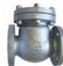
Válvula retención de acero fundido bridada 150 lbs.