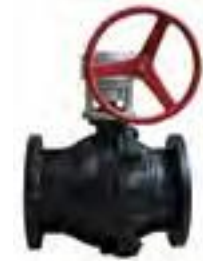
Válvula esfera bridada 150 lbs. paso completo, cpo. de 2 pzas.