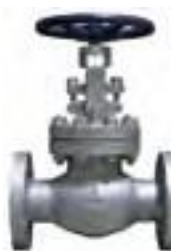
Válvula globo de acero fundido bridada 300 lbs.