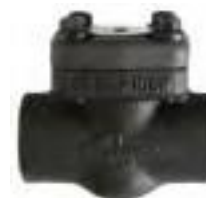
Válvula retención tipo pistón de acero forjado clase 800 roscada y socket weld