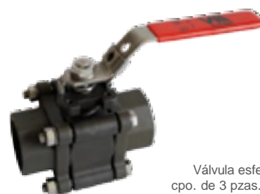
Válvula esfera paso estándar, cpo. de 3 pzas. 1500-2000 WOG