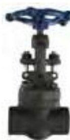
Válvula compuerta de acero forjado clase 800 roscada y socket weld