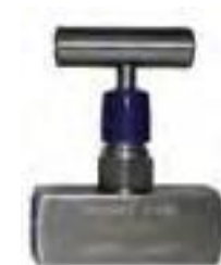
Válvula de aguja acero al carbón forjado A105 y acero inoxidable tipo 316, 6000LBS.