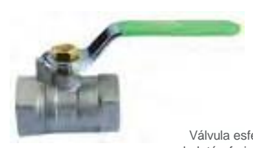
Válvula esfera de latón forjado 300 WOG