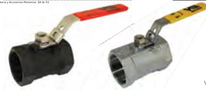
Válvula esfera paso reducido, cpo. de 1 pza. 1000 WOG