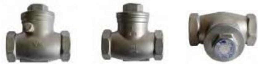
Válvula retención de acero inoxidable roscada 200 lbs.