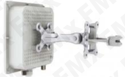
A SOLO: 760.00 USD ANTENA PUNTO A PUNTO Clave: PTP 5-N PRO

Punto De Acceso Inalámbrico para enlace punto a punto marca LigoWave. Rango de frecuencia 5150-5915 MHz; Potencia de Transmisión 30dBm; MiMo 2x2; 2 puertos N Macho; Interfaz Ethernet 10/100/1000 Base T; Capacidad de 220 Mbps agregado (110 Mbps Full Dúplex); 65,000 pps; Protector de descarga integrado. Hasta 100 km de alcance. 2 años de garantía.