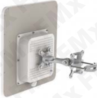
A SOLO: 830.00 USD ANTENA PUNTO A PUNTO Clave: PTP 5-23 PRO

Punto De Acceso Inalámbrico para enlace punto a punto marca LigoWave. Rango de frecuencia 5150-5915 MHz, potencia de Transmisión 30 dBm y MiMo 2x2. Antena integrada de 23 dBi MiMo 2x2. Interfaz Ethernet 10/100/1000 Base T. Capacidad de 220 Mbps agregado (110 Mbps Full Dúplex); 65,000 pps. Protector de descarga integrado. Hasta 50 km de alcance. 2 años de garantía.