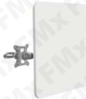
A SOLO: 333.00 USD ANTENA PUNTO A MULTIPUNTO Clave: APC MACH-5

Radio con modo de Operación Punto a Punto a Cliente en caso de multipunto Marca Deliberant. Frecuencia 5 GHz y hasta 160 Mbps de throughput. Potencia de transmisión 29 dBm y modo de radio MiMo 2x2. Estándar 802.11 a/n, antena direccional integrada de 23 dBi, interfaz Ethernet 10/100 Base T. Modo de Operación Bridge, Router, hasta 50km en modo PTMP, Alimentación PoE y Consumo 6.5W