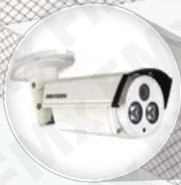
VIDEO VIGILANCIA PAG. 197