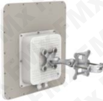
A SOLO: 956.00 USD ANTENA PUNTO A PUNTO Clave: PTP 5-23 UNITY

Punto De Acceso Inalámbrico para enlace punto a punto marca LigoWave. Rango de frecuencia 4990-5915 MHz, potencia de Transmisión 28 (+/-)2 dBm y MiMo 2x2. Antena integrada de 23 dBi MiMo 2x2, Interfaz Ethernet 10/100/1000 Base T. Capacidad de 220 Mbps agregado (110 Mbps Full Dúplex) y hasta 400 Mbps Enlace asociado. 140,000 pps. Protector de descarga integrado. Hasta 50 km de alcance. 2 años de garantía.