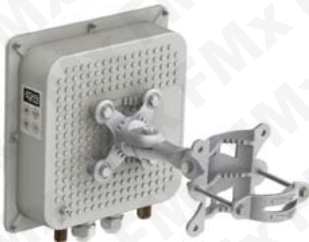
A SOLO: 886.00 USD ANTENA PUNTO A PUNTO Clave: PTP 5-N UNITY

Punto De Acceso Inalámbrico para enlace punto a punto marca LigoWave. Rango de frecuencia 4990-5915 MHz, Potencia de Transmisión 28 (+/-)2dBm y MiMo 2x2. 2 puertos N Macho, Interfaz Ethernet 10/100/1000 Base T, Capacidad de 220 Mbps agregado (110 Mbps Full Dúplex) y hasta 400 Mbps Enlace asociado. 140,000 pps, Protector de descarga integrado y enlace de hasta 50 km. 2 años de garantía.