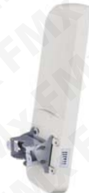
A SOLO: 131.00 USD ANTENA PUNTO A MULTIPUNTO Clave: APC 5M 90

Access Point marca Deliberant. Frecuencia 5 GHz y hasta 160 Mbps de throughput. Potencia de transmisión 29 dBm, modo de radio MiMo 2x2, estándar 802.11 a/n, antena sectorial integrada de 18 dBi y apertura de 100°. Interfaz Ethernet 10/100 Base T, modo de operación bridge y Router. Hasta 7 km en modo PTMP, alimentación PoE y consumo 6.5W.