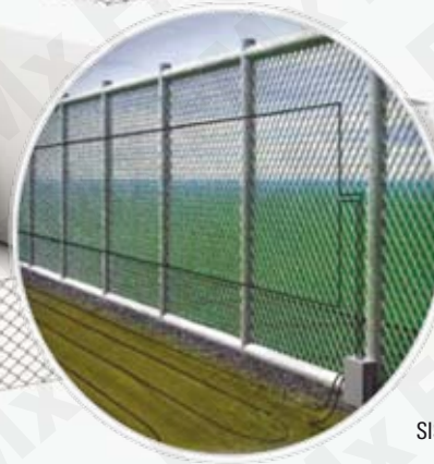
SISTEMA DE SEGURIDAD Perimetral

Los Sistemas de seguridad a través de fibra óptica tienen la función de detectar intromisiones en zonas restringidas, utilizando las bondades de la fibra óptica para transmitir señales de aviso, las cuales son captadas por una unidad de procesamiento de alarmas (APU) que se encarga de dar aviso al personal correspondiente para el análisis de dicha intromisión.