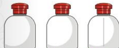
línea campana 50 ml