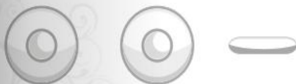
Circular 20 gr. y 50 gr.