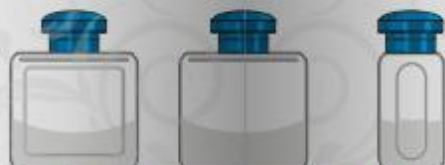
línea elegancia 40 ml