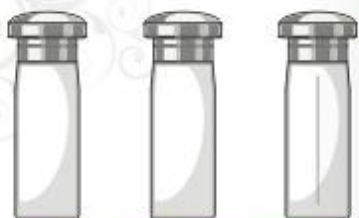
línea perfume 25 ml