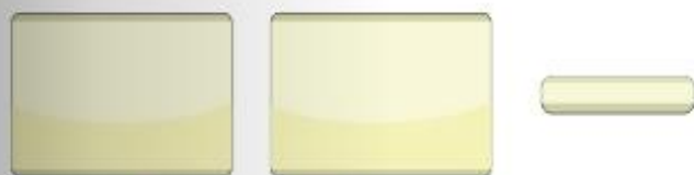
Artesanal 30gr. y 45 gr.