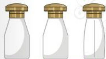
línea ánfora 30 ml