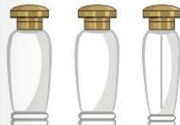
línea cazadora 40 ml