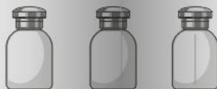
línea hongo 30 ml