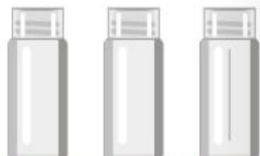
línea cilindrica 40 ml