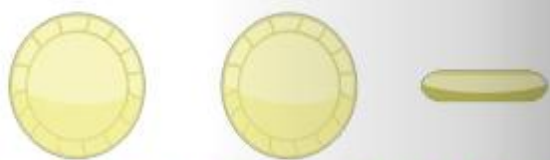
Circular grecas 20 gr. , 30 gr. y 50 gr.