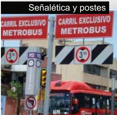
Señalética y postes