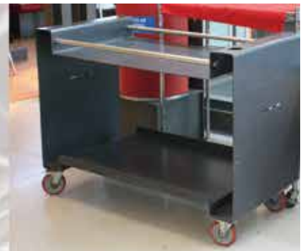
Carros de biblioteca