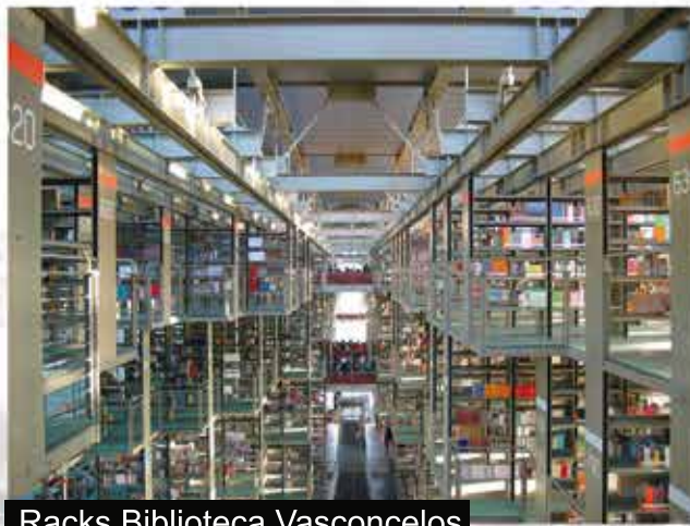
Racks Biblioteca Vasconcelos