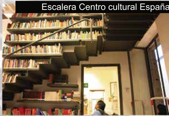
Escalera Centro cultural España