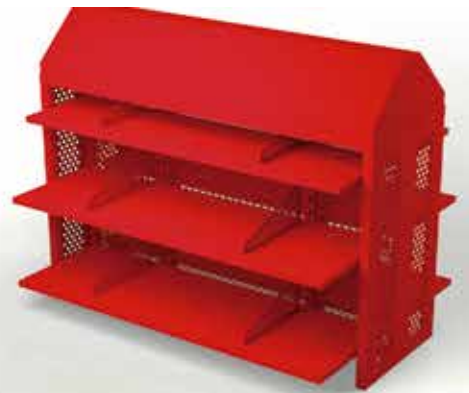
Mueble Nike para ropa