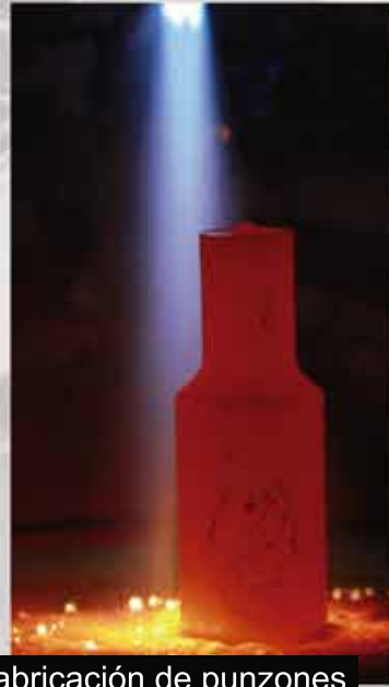
Fabricación de punzones