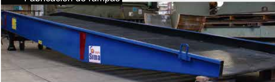
Fabricación de rampas