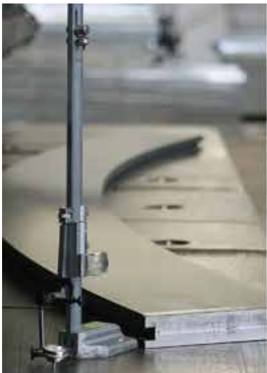
Precisión en medidas