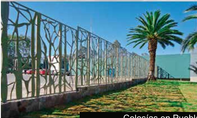
Celosías en Puebla