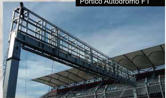
Pórtico Autódromo F1