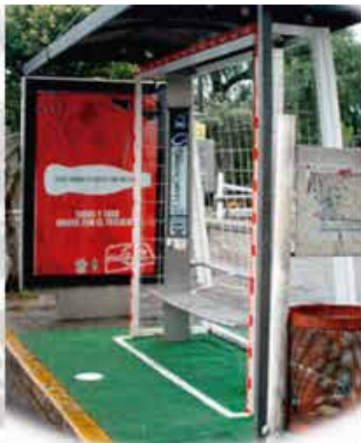
Paradores de autobús