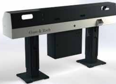
Alimentador de barras