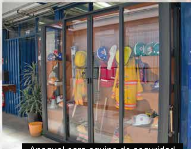
Anaqueles para equipo de seguridad